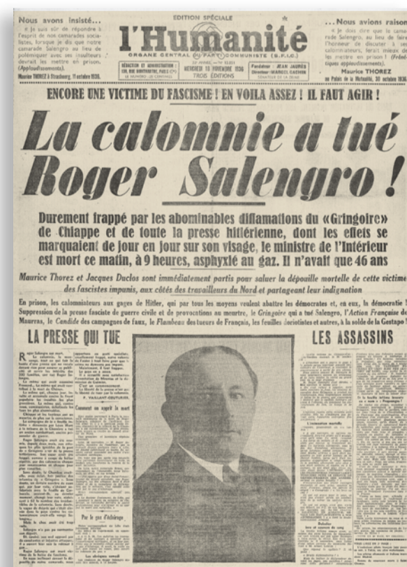
L'Humanité , 18 novembre 1936

Si l' Action française , en 1936, accuse (à tort) Roger Salengro, ministre du gouvernement Blum, d'avoir déserté durant la Première Guerre mondiale, c'est Gringoire qui publie le jeu de mots de trop : « L'affaire Proprengro ». Après des mois de calomnie publique, le ministre se suicide. Aussitôt, la presse, fascinée par son propre pouvoir de mort, explique de façon simpliste le passage à l'acte