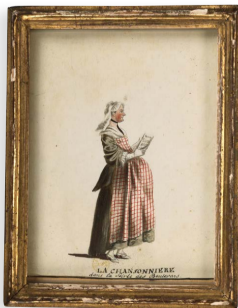
La chansonnière (série sur les personnages de théâtre), Fesch et Whirsker, xviii e siècle

Au xviii e siècle, les moqueries mises en musique sur des airs connus et diffusées partout entrent facilement dans les cerveaux. La police condamne ces vers séditieux composant un bruit de fond redoutable et incontrôlable. Dans ce dessin charriant le stéréotype sexiste de la commère, la chansonnière semble symboliquement grosse d'un enfant monstrueux : la calomnie, prête à se déverser sur le monde !