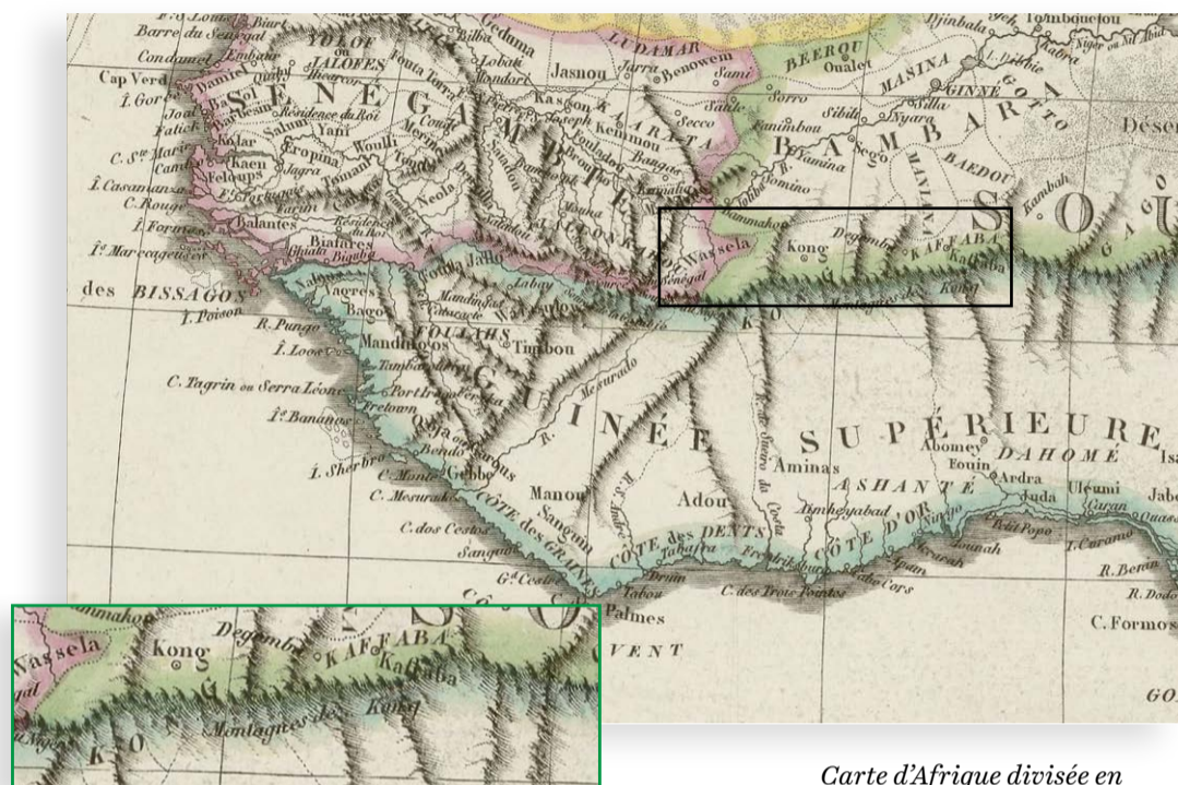
Carte d'Afrique divisée en ses principaux États avec les découvertes, E. Hérisson, 1820

La Terre est-elle plate comme une pizza? Pythagore et Aristote luttèrent déjà contre l'idée... En 2017, malgré les images satellite, certains Français adhèrent encore à cette théorie! Si les sciences font depuis longtemps l'objet de contestations, ce phénomène s'est aujourd'hui accentué. Le nombre de sources disponibles n'a jamais été aussi grand. L'information est moins filtrée par la presse spécialisée. La différence entre savoir et information, science et opinion n'est parfois plus perçue. De plus, le développement de journaux prédateurs jette le doute sur les articles scientifiques.